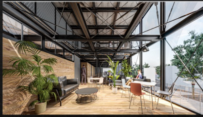
コワーキングスペース