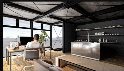
プライベートルーム