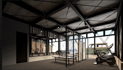
トレーニングジム

地域の経営者に向けて特別な空間を提供し、事務所として、会議スペースとして使用していただきます。さらには、快適に過ごすよう、様々な空間を備えております。